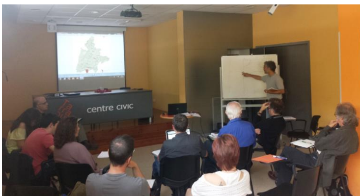
Sessió de treball de la Taula 1 (Recerca científica i didàctica de les Ciències de la Terra) del 13 de maig de 2015. Lloc: Centre Cívic Tarraquet (Tremp).

Per facilitar l'organització de la informació, totes les reunions estan reflectides a les actes corresponents. A l'annex 6.1 s'inclou, com exemples, una acta de cada taula.